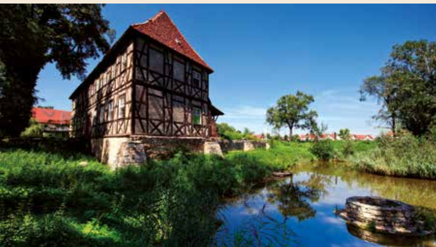
Dworek renesansowy w Bielanych Wrocławskich pochodzi z XVI wieku.