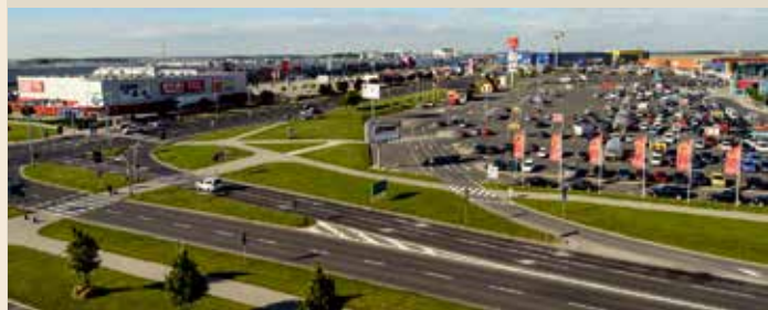
W 1993 roku holenderska firma Makro Cash&Carry postanowiła zainwestować na terenach położonych w Węzle Bielańskim. Już rok później otwarto tam Centrum Handlowo - Usługowe Bielany I, a w 2001 roku Park Handlowy Auchan. W 2004 roku uruchomiono Centrum Handlowo - Usługowe Bielany II, tym samym powstało największe w Polsce centrum handlowe. Ponadto w Bielanach Wrocławskich ulokowały swoje siedziby fabryki oraz duże centra logistyczne.