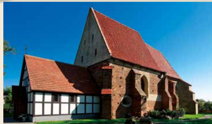
Kościół parafialny pod wezwaniem Wniebowzięcia Najświętszej Marii Panny w Tyńcu Małym, to typowo gotycki jednonawowy kościół z wieżą przy północnej ścianie.