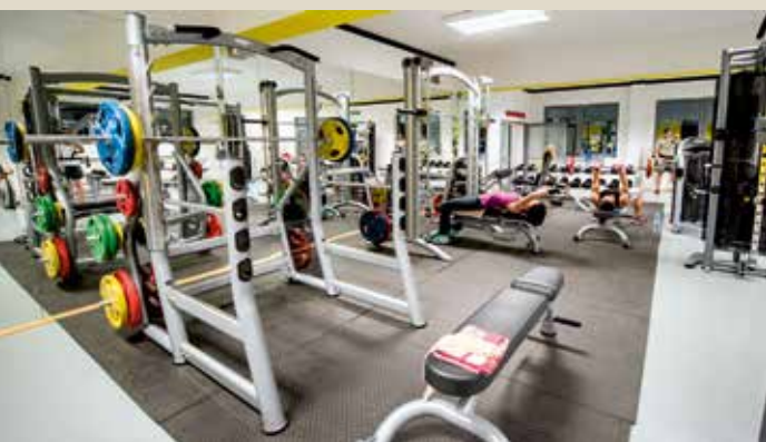
Siłownia znajdująca się w Hali Sportowo - Widowskowej w Kobierzycach przyciąga sportowców nowoczesnym sprzętem.