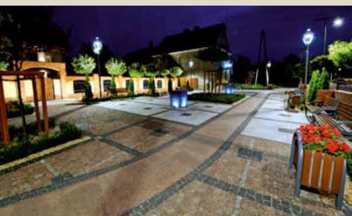
Jedną z głównych ulic Kobierzyc, ul. Robotnicza, dziśniejszy nowoczesny, estetyczny wygląd zawdzięcza wyremontowanym, odnowionym budynkom oraz elementom małej architektury i nowym nasadzeniom krzewów i drzew.