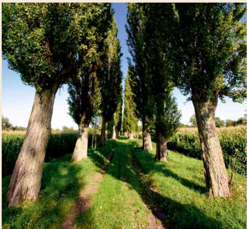
Zabytkowy szpaler zieleni - aleja topolowa w Magnicach.

Przez wiele miejscowości Gminy Kobierzyce prowadzi również, wytyczony w 2011 roku, oznaczony symbolem rowerzysty, szlak rowerowy, tworzący pętlę, której początek i koniec znajduje się w Kobierzycach przy Alei Pałacowej.