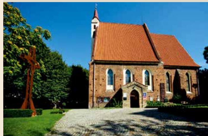
W centrum miejscowości Wierzbice znajduje się otoczony obronnym murem gotycki kościół pod wezwaniem Bożego Ciała i Matki Bożej Częstochowskiej.