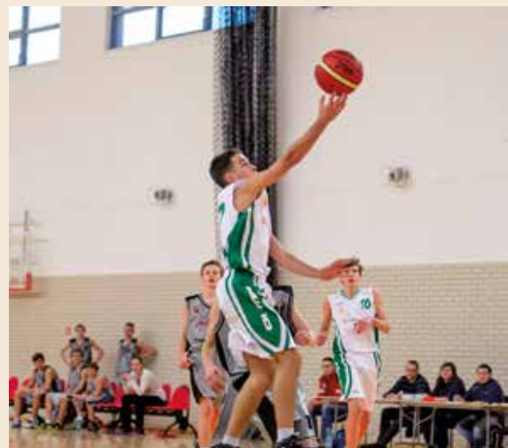
W Gminie Kobierzycy dużym zainteresowaniem cieszy się również koszykówka.

Mieszkańcy gminy, którzy chcą uprawiać sport, mają do tego doskonałe warunki. W wielu miejscowościach istnieją dobrze utrzymane boiska, siłownie i sale do fitnessu. W Kobierzycach funkcjonuje oddana do użytku w 2011 roku nowoczesna Hala Sportowo - Widowskowa wraz z siłownią.