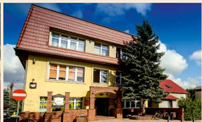
Gminny Ośrodek Pomocy Społecznej w Kobierzycach zyskał nową siedzibę w 2007 roku. Głównym zadaniem GOPS-u jest pomoc mieszkańcom w radzeniu sobie w trudnych sytuacjach życiowych.

W trosce o środowisko naturalne zostały rozbudowane stare oraz powstały nowe oczyszczalnie ścieków. Od kilku lat trwają też prace nad zbiorowym systemem odprowadzania nieczystości. W 2010 roku zakończono rekultywację składowiska śmieci w Cieszykach, dzięki czemu mieszkańcy zyskali ok. 2 ha nowych terenów zieleni. Skanalizowana jest już północna część gminy, a do 2015 roku planuje się zakończenie budowy kanalizacji w 10 wsiach w części południowo - zachodniej. Wszystkie miejscowości na terenie Gminy Kobierzycy posiadają wodociągi, jednakże ze względu na szybki rozwój budownictwa i nowe inwestycje przemysłowe podejmowane są prace przy modernizacji stacji uzdatniania wody.