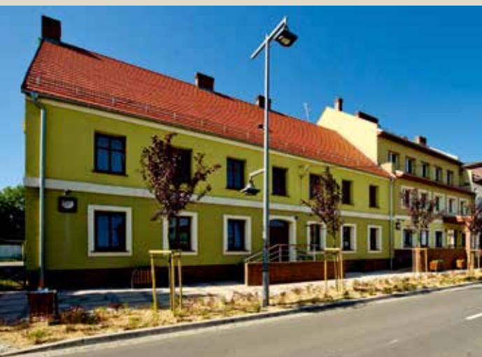
Dzięki rewitalizacji miejscowości Kobierzycy ul. Witosa zyskała nowoczesny wygląd.