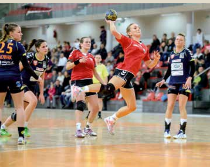
Na meczach I ligi z udziałem Klubu Piłki Ręcznej Gminy Kobierzycy nie brakuje emocji i efektownych akcji.