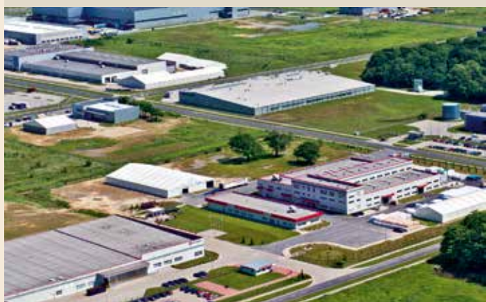
W Tarnobrzeskiej Specjalnej Strefie Ekonomicznej w Biskupicach Podgórnych znajduje się europejskie centrum produkcyjne koncernu LG Electronics, produkuje się tu telewizory ciekłokrystaliczne, lodówki i pralki.