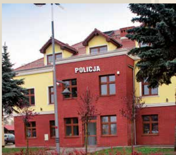
Posterunek Policji w Kobierzycach dzisiaj jest powodem dumy funkcjonariuszy.