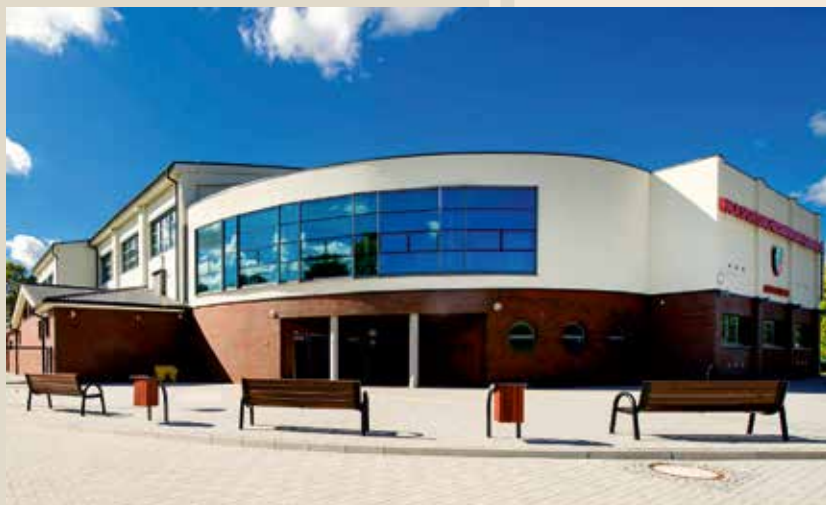
W Hali Sportowo – Widowskowej w Kobierzycach znajduje się pełnowymiarowe boisko do piłki nożnej, widownia na 650 osób, zaplecze sportowe oraz 2 mniejsze sale do fitnessu, sportów walki oraz siłownia.

Biorą w nim udział uczniowie wszystkich typów szkół z terenu Gminy Kobierzycy, dorośli mieszkańcy gminy oraz pracownicy zakładów pracy. Dla najmłodszych uczestników maratonu często jest to pierwsza okazja do przeżycia prawdziwych sportowych emocji.